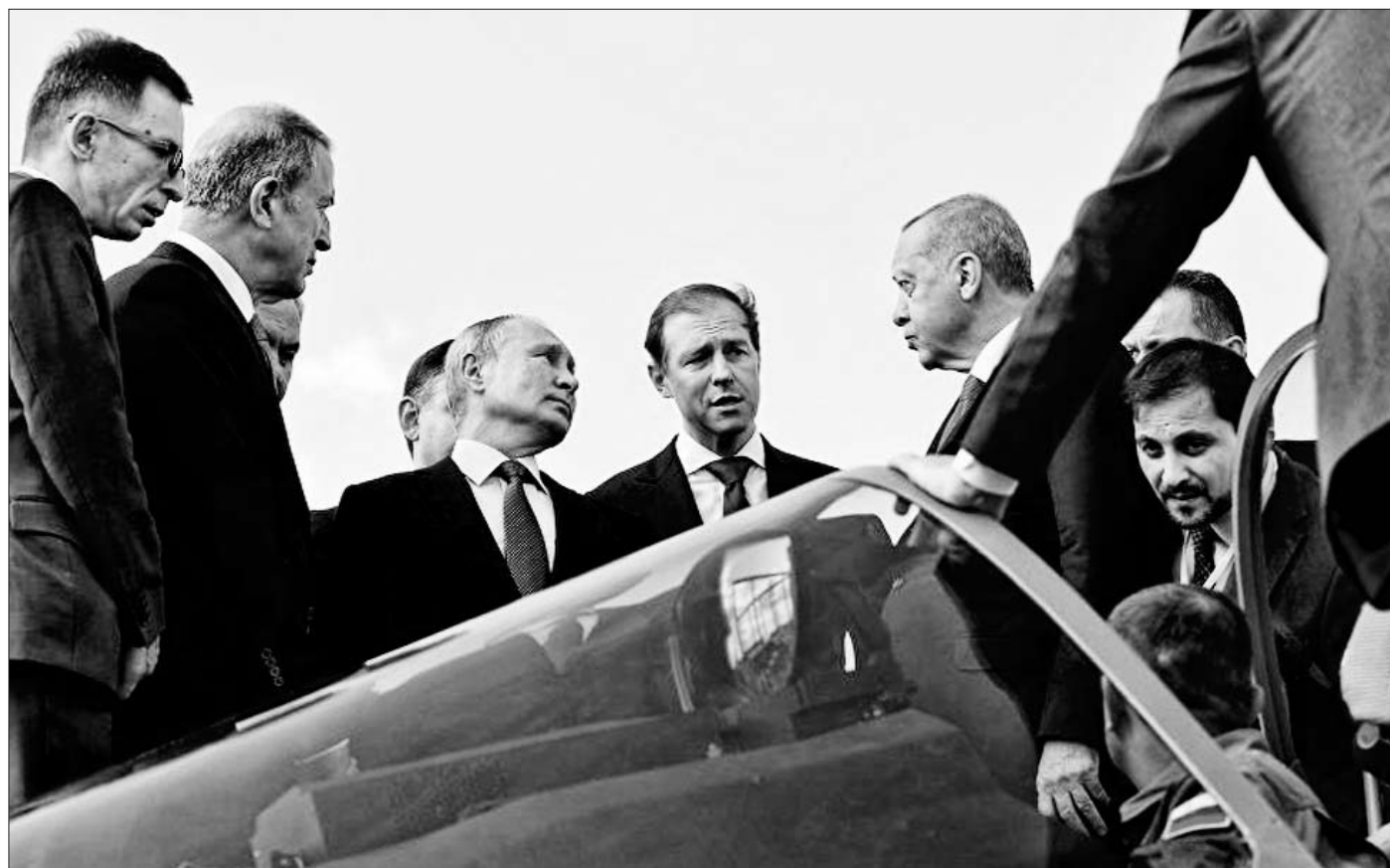
Президент России Владимир Путин и президент Турции Реджеп Тайип Эрдоган на экспозиции Объединенной двигателестроительной корпорации.

Также дипломантом конкурса «Авиастроитель года» в номинации «За вклад в обеспече-