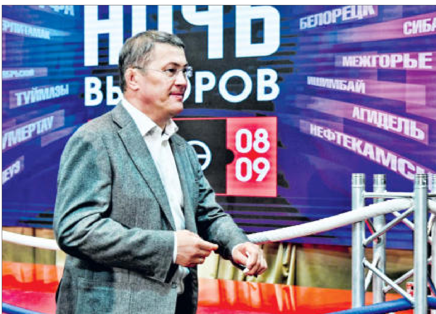
За Радия Хабирова проголосовало более восьмидесяти процентов избирателей.