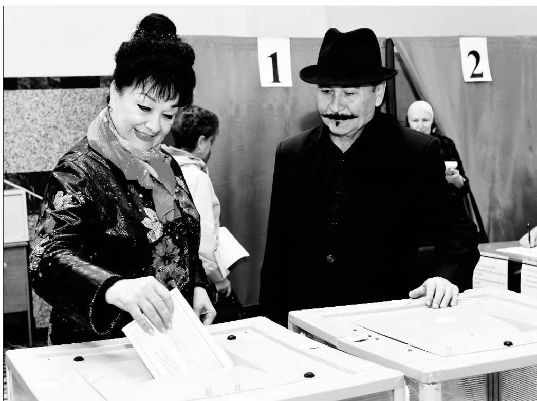
На избирательном участке БГУ знаменитая певица Назифа Кадырова голосует уже почти сорок лет.

— Думаю, больше его не стоит использовать для проведения выборов, — заметил Михаил Федотов. — А Центризбирком РФ в качестве системного решения проблемы надо разработать единые методические рекомендации для подбора помещений, предназначенных для голосования. Чтобы решить проблему раз и навсегда.