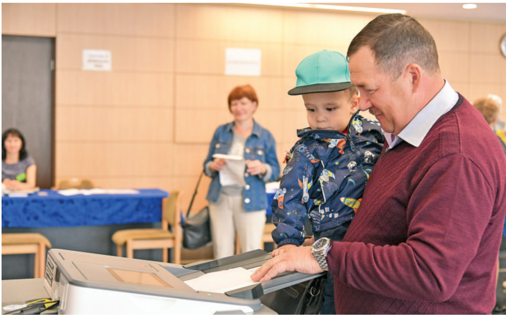
Өфөләгә 109-сы участкаһы һайлау барышынан күрәнеш.

Статистика мәғлүмәттәре күрһәткәнсә, ғәзәттә, һайлауларға ауыл халыҡ өҙөмәткә катнаша. Был ғәмәл 9 сентябрҙә тағы бер рәшәланды, шул уҡ ваҡытта