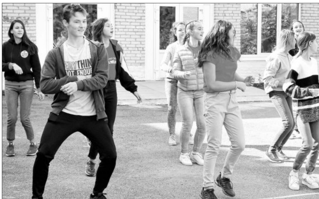
На флешмобе юные участницы смогли потанцевать под энергичную музыку.

Жители Башкирии, отправившиеся в воскресенье на выборы, смогли не только выполнить гражданский долг, но и принять участие в Днях открытых дверей.