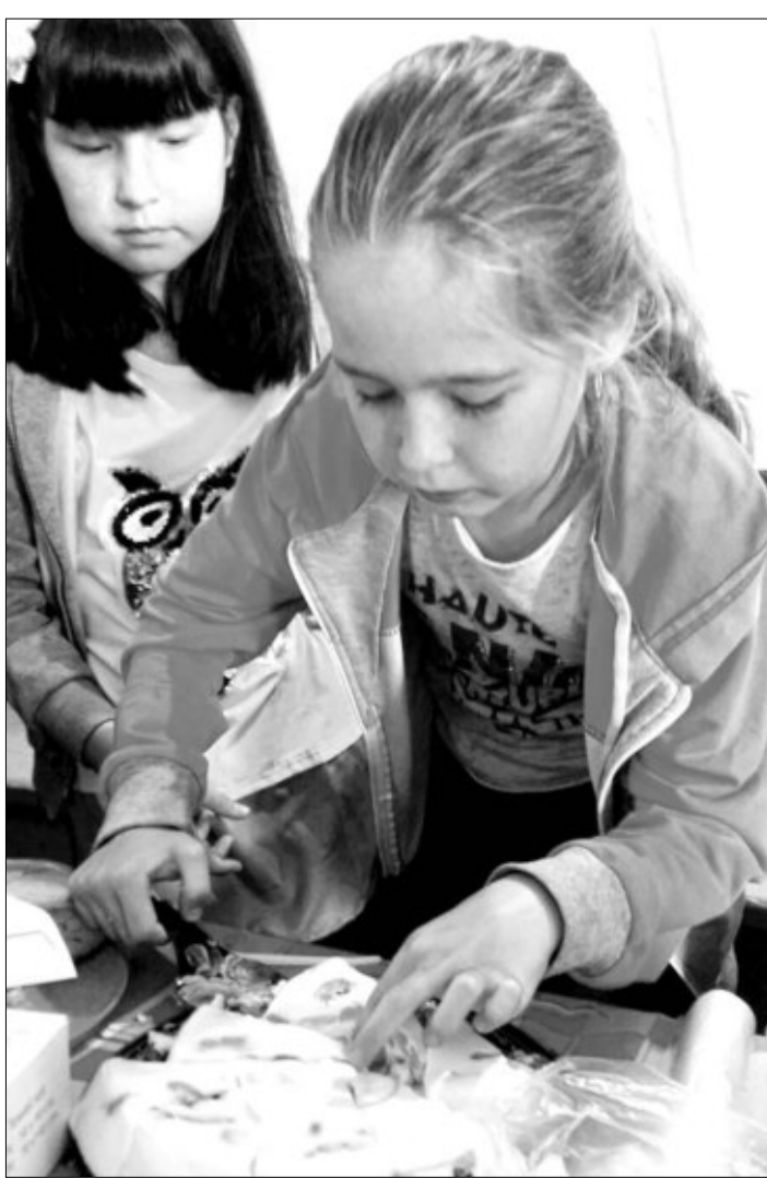
На ярмарке можно было купить все, особенно сладости.