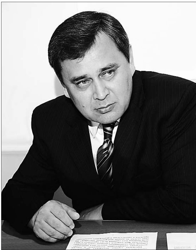
Избирательная система республики часто становилась испытательным полигоном при внедрении различных технологических и технических новшеств.